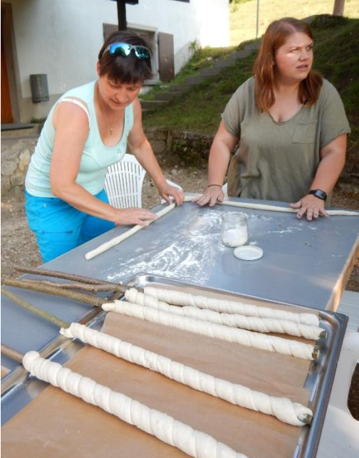
Am Abend war Schlangenbrot mit Hamburger vom Grill angesagt.