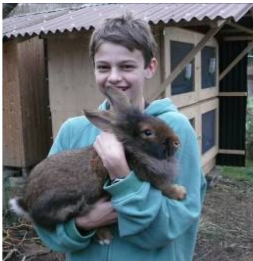
Das Kaninchen richtig tragen

Kaninchen dürfen niemals nur an den Ohren hochgehoben werden!