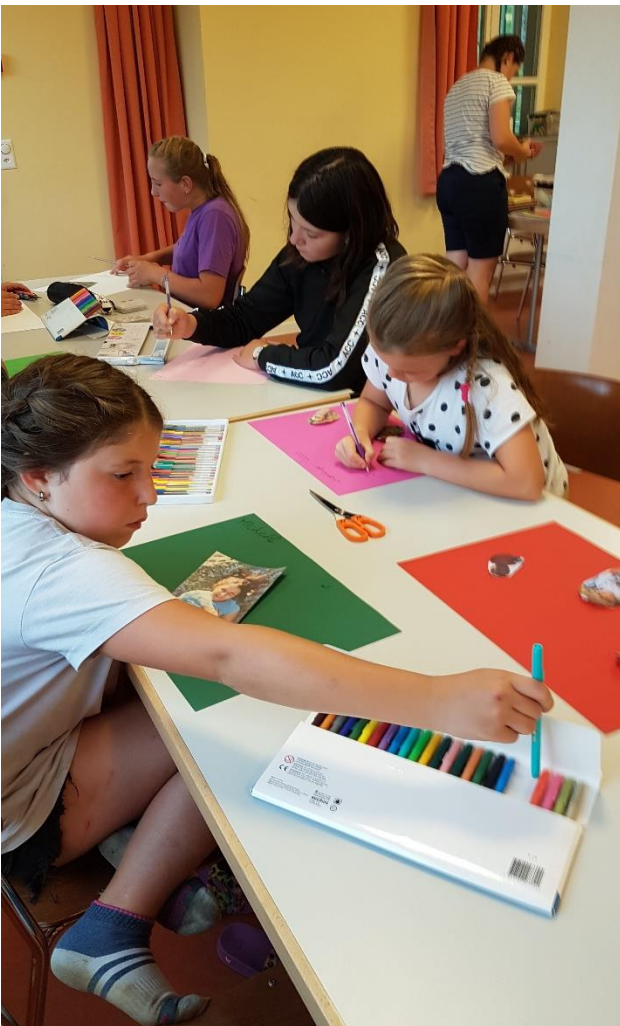
Wer wollte, hatte auch die Möglichkeit ein eigenes Tischset zu gestalten.