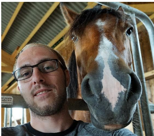
Ce cheval tenait à être présent sur l'image de notre photographe animalier «Michi».