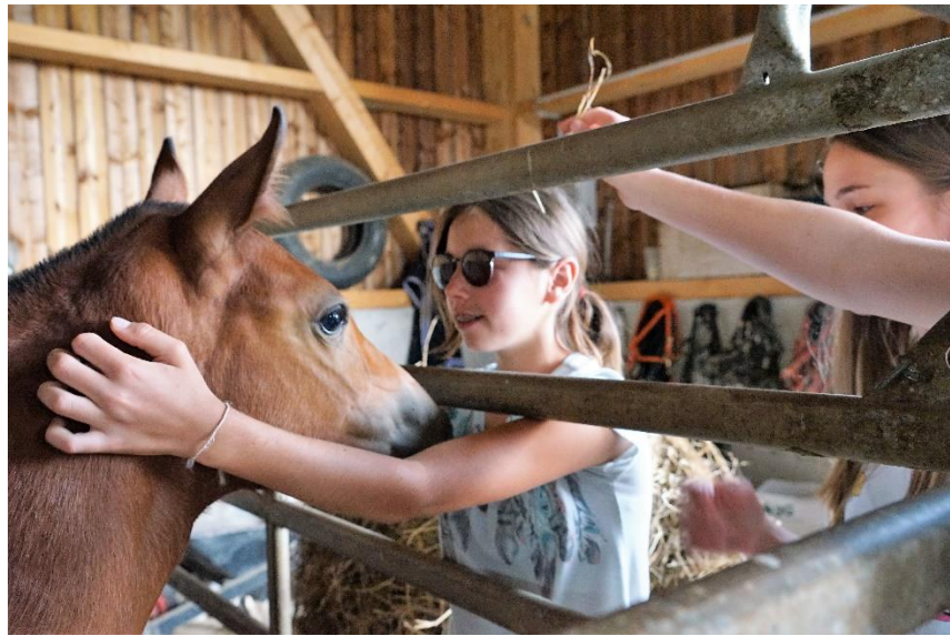
Flatter, câliner, s'approcher, – les chevaux y sont habitués