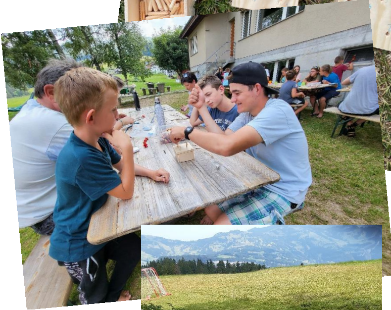
Bien sûr, ce jeu devait être testé tout de suite.