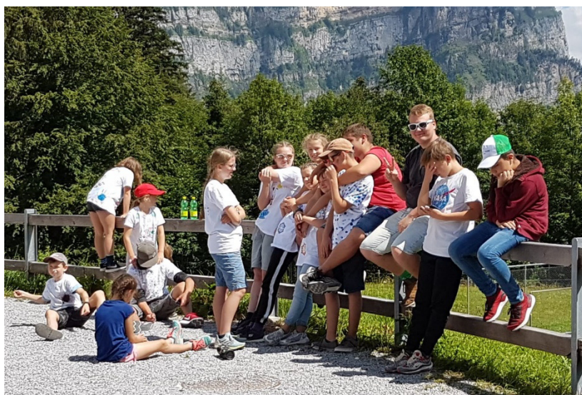
Le temps des aurevoirs s'approche de plus en plus ...