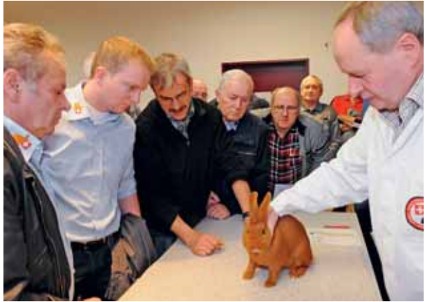
Critique de race à l'exposition du club du Doré de Saxe.

La commission « membres » de Petits animaux Suisse a fait un excellent travail et ses documents aident les sections et clubs. Qui utilise ces documents ? Les classeurs d'archivage ne font pas de promotion pour de nouveaux membres. Seuls les comités et sociétés à la recherche intensive de nouveaux membres auront du succès. Il y a encore des sociétés et des clubs qui n'ont pas réussi à créer un envi-