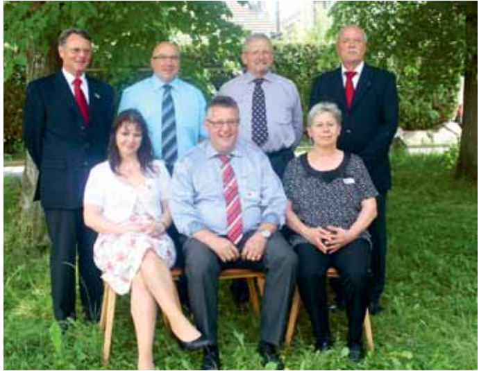
Comité Lapins de race Suisse.

La fédération a pu faire l'an dernier encore un petit bénéfice. Grâce aux rentrées extraordinaires des provisions ont pu être faites pour des projets décidés tels qu'achat ou adaptation des cages d'expositions ainsi que la formation continue des experts. La diminution du bénéfice de la Tierwelt aura comme conséquence la réduction des rentrées. Le bud-