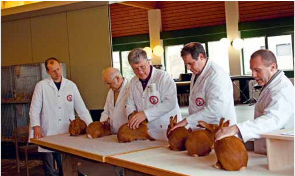
Experts au travail.