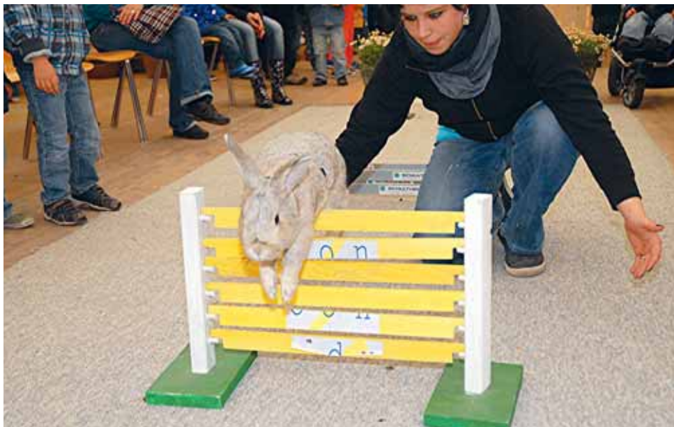
Saut de lapin a le vent en poupe.

La commission technique travaille intensément à la révision du standard. Pour le standard il est essentiel d'avoir une clairvoyance à long terme. Ce qui apparaît à priori irréalisable, devient dans un deuxième temps chose raisonnable. Les entretiens permettent d'aboutir à un ouvrage que la grande majorité approuvera à la CPP 2015. C'est avec conviction que la commission technique et le comité s'y attendent. Nous nous réjouissons de l'exposition de lapins mâles 2015 à Sempach. Les candidats au « Mister suisse » prospèrent tous les jours. Les discussions avec les responsables de l'OSAV apporteront la solution comment créer un espace de retrait dans les cages d'expositions. Nous avons soumis des propositions concrètes. Les clubs de race auront la possibilité de se présenter dans un magazine commun lors de la prochaine exposition suisse de lapins mâles. La journée d'automne du 13 septembre 2014 sera consacrée aux visions. Nous espérons avec le thème « Utopie ou réalisme » enthousiasmer de nombreux éleveurs. La journée est ouverte au public. Le projet clapier pour les écoles offre des solutions nouvelles et servira pour les sections comme matériel publicitaire. L'offre des cours est adaptée aux besoins. Nous souhaitons avec les fédérations cantonales et les clubs soutenir au maximum nos membres.