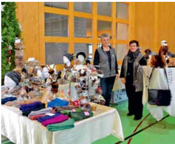
Présentation couture sur peaux dans le canton de Glaris.

cours pour professeurs de technologie et travaux manuels servent à enthousiasmer de nouvelles personnes. Les diverses sections mettent tout en œuvre pour être actives lors d'expositions, présenter et vendre leurs produits et aussi faire de la publicité pour cette occupation de temps libre. Je remercie le comité de Couture sur peaux Suisse pour la collaboration coopérative.