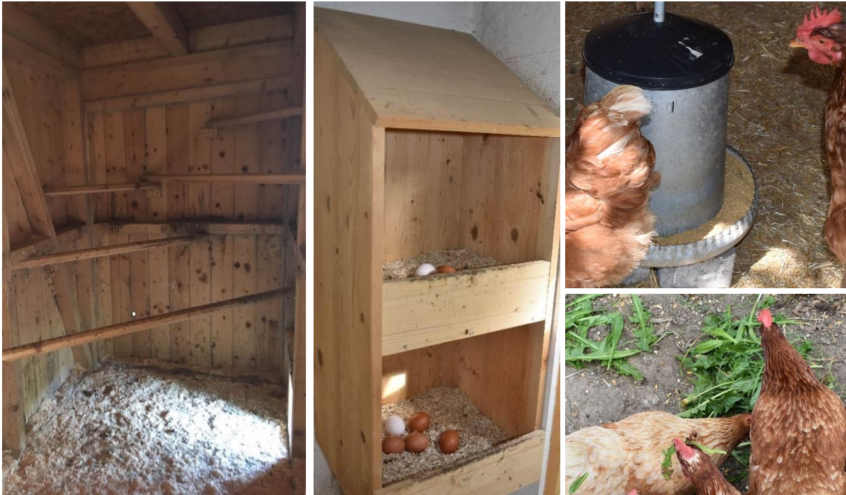
Abbildung 3: Im ersten Bild sind 5 Sitzstangen in unterschiedlichen Höhen zu sehen. Das mittlere Bild zeigt zwei auf drei Seiten und oben geschlossene Nester mit Einstreu. Rechts oben ist ein runder Futtertrochler sichtbar. Löwenzahn und Körner werden als Ergänzung angeboten.