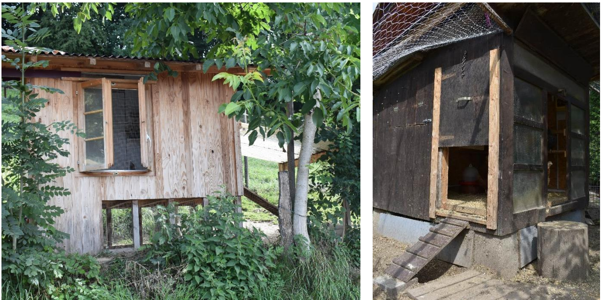
Abbildung 2: Zwei Beispiele von Ställen mit grossen Öffnungen, die Licht und Frischluft hereinlassen. Das linke Vordach des Stalls lässt sich an den Seiten mit Drahtgeflecht abschliessen, wodurch ein Wintergarten entsteht. Die Auslaufläche des Stalls auf der rechten Seite ist mit einem Netz abgegrenzt.

Die optimale Besatzdichte hängt u. a. von der Grösse und Stabilität der sozialen Gruppe ab. Bei kleinen Gruppen von 2 bis 15 Tieren wird eine Dichte von höchstens 4 Hühnern pro m 2 empfohlen.