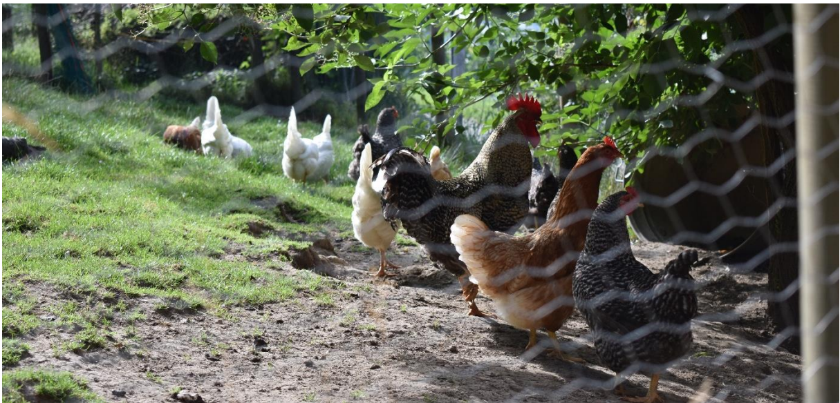
Abbildung 5: Auslaufläche mit natürlichem Schatten, Erde für Staubbäder sowie Gras für das Erkunden und Picken.

Der Stall muss mit Tageslicht beleuchtet sein und die Beleuchtungsstärke muss mindestens 5 Lux betragen, idealerweise aber mehr (siehe Art. 33 und 67 TSchV).