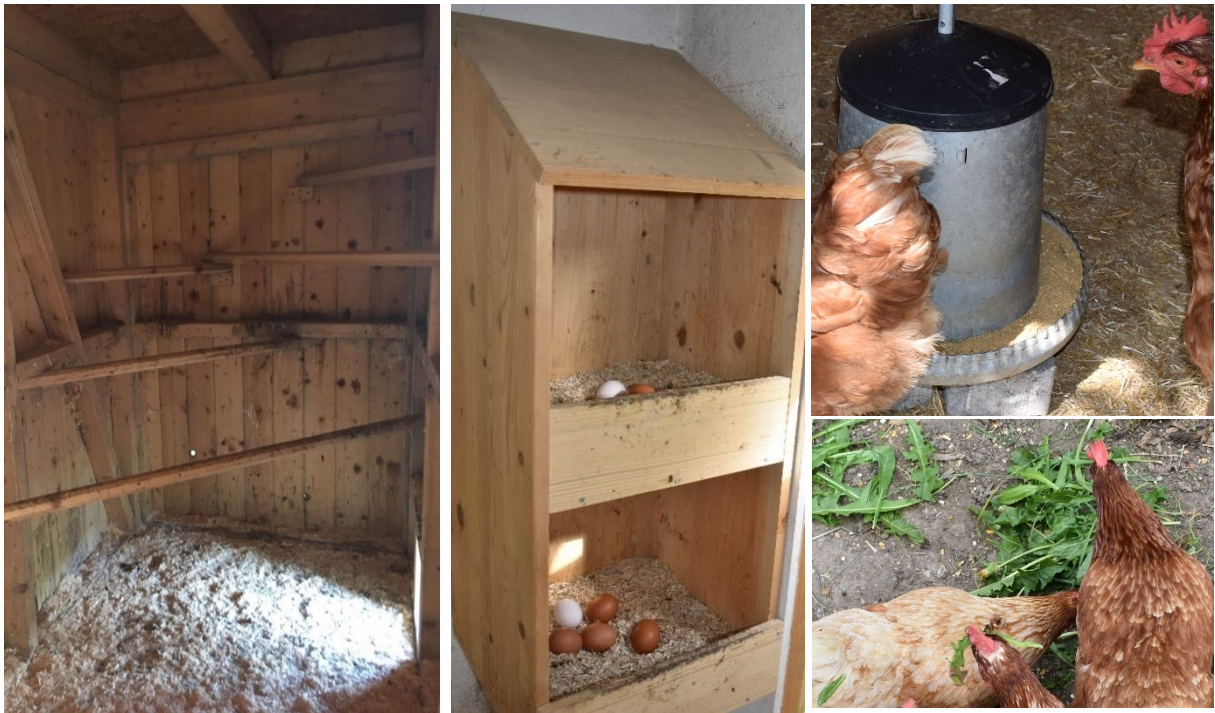
Abbildung 3: Im ersten Bild sind 5 Sitzstangen in unterschiedlichen Höhen zu sehen. Das mittlere Bild zeigt zwei auf drei Seiten und oben geschlossene Nester mit Einstreu. Rechts oben ist ein runder Futtertroch sichtbar. Löwenzahn und Körner werden als Ergänzung angeboten.