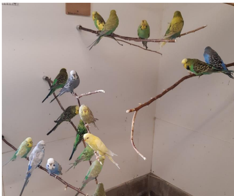
Une volée de perruches ondulées dans la volière