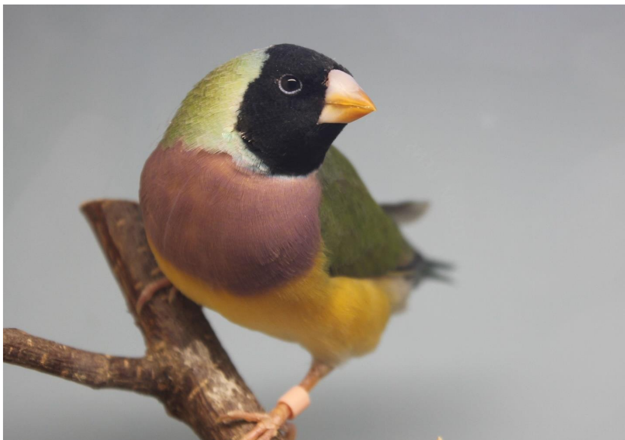
0.1 Amadine de Gould à tête noire