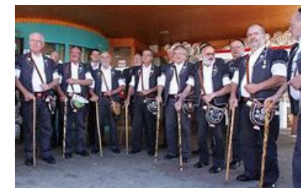
Les Armaillis de la Gruyère an der offiziellen Eröffnung