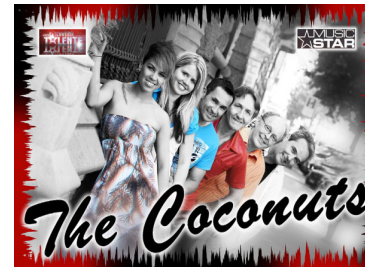
Orchester 'The Coconuts'