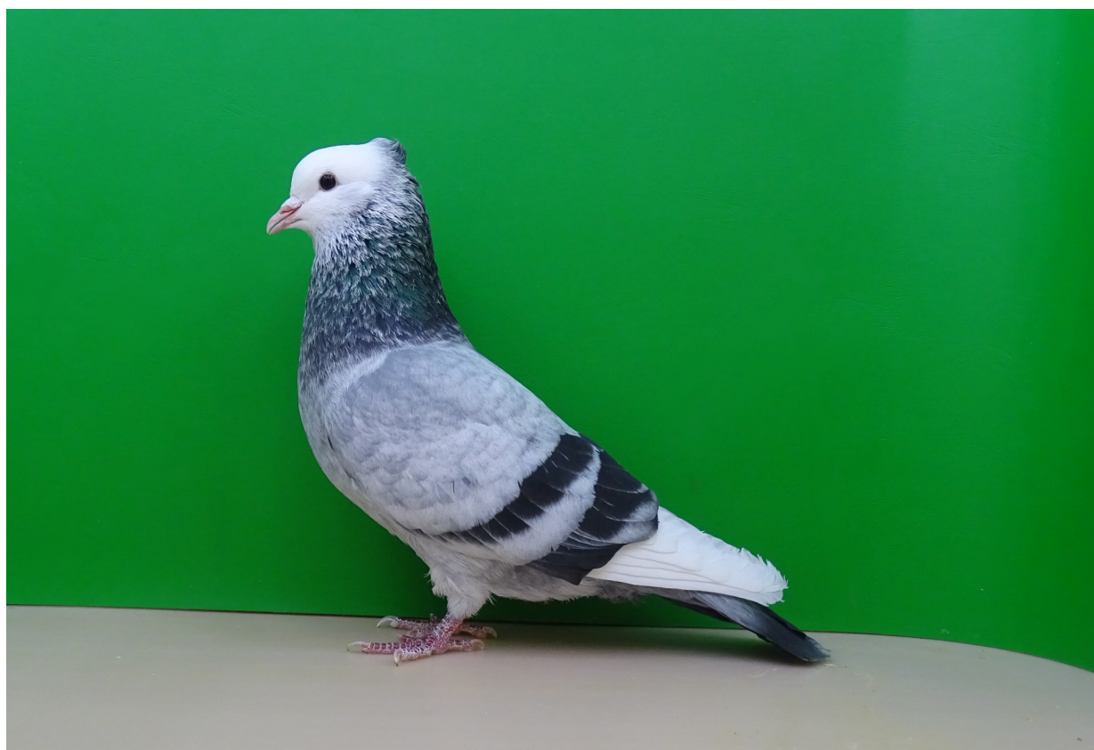
Rheinischer Ringschläger, blau-schimmel