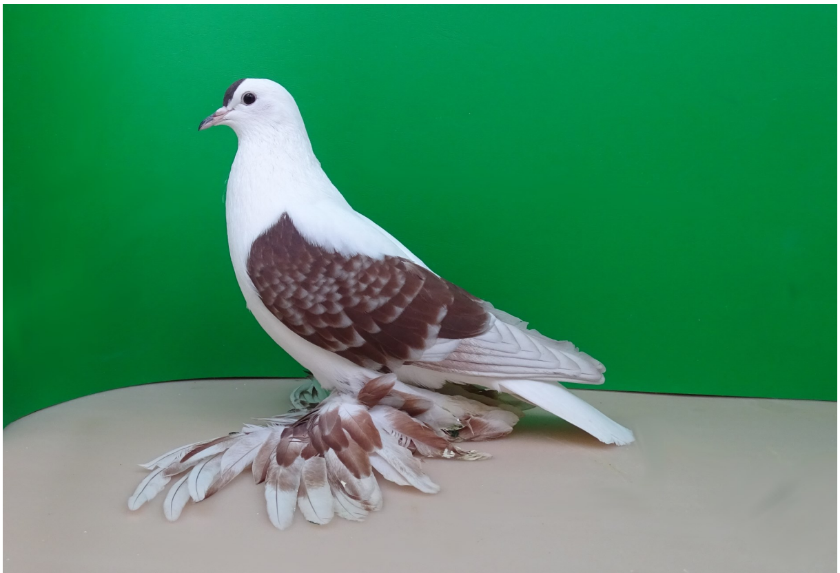
Sächsische Flügeltaube, Reisserflügel rot