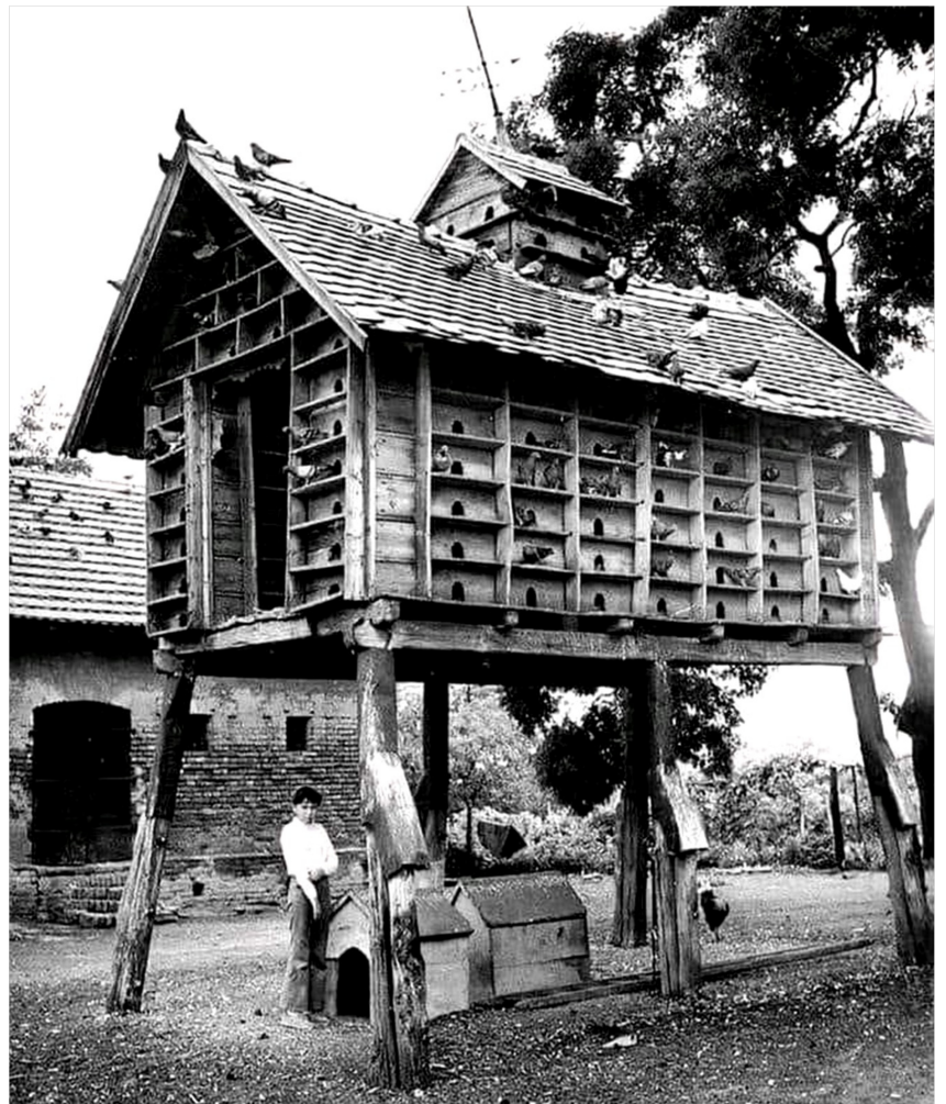
Zeit und Ort der Aufnahme leider unbekannt