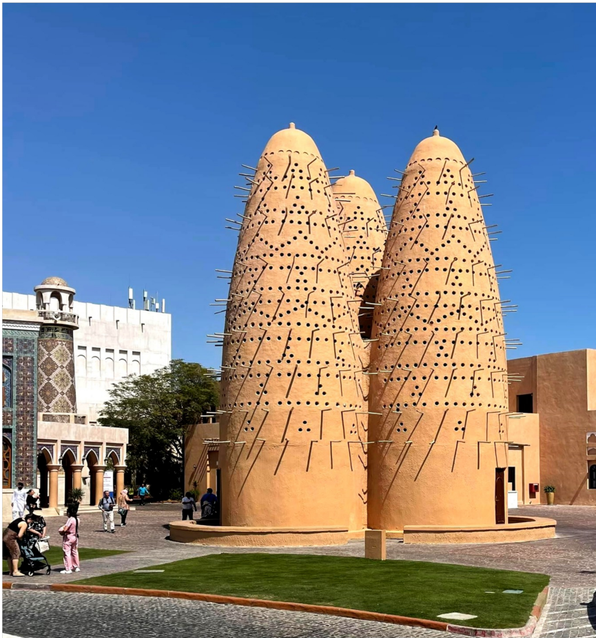
Denkmalgeschützter Taubenschlag in Katar