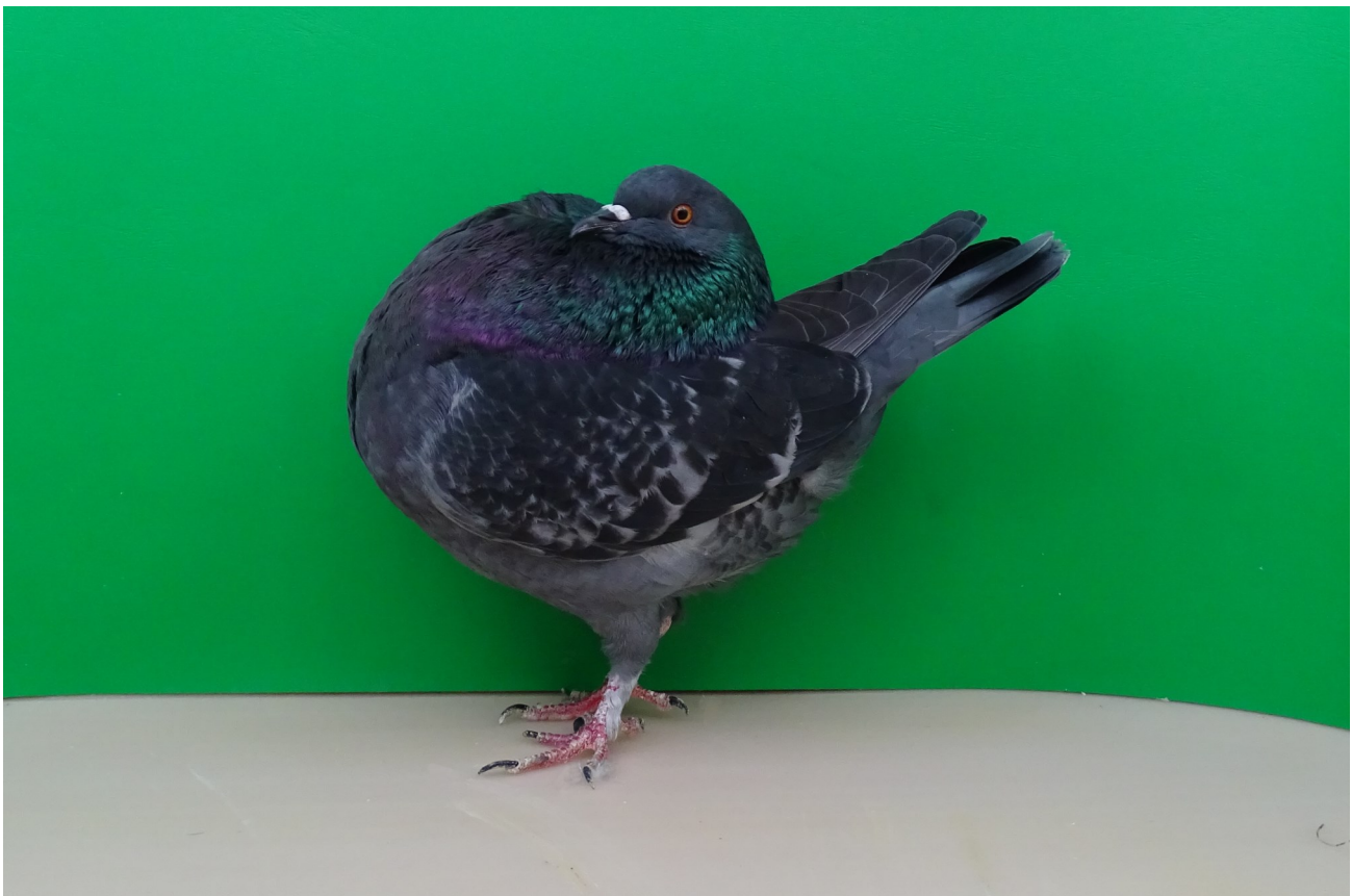
Amsterdamer Kröpfer, blau gehämmert

Pour les conferences : Tous les juges colombophiles reconnus de Pigeons de race Suisse, les vétérinaires et membres du comité de Pigeons de race Suisse ainsi que les rédacteurs du magazine