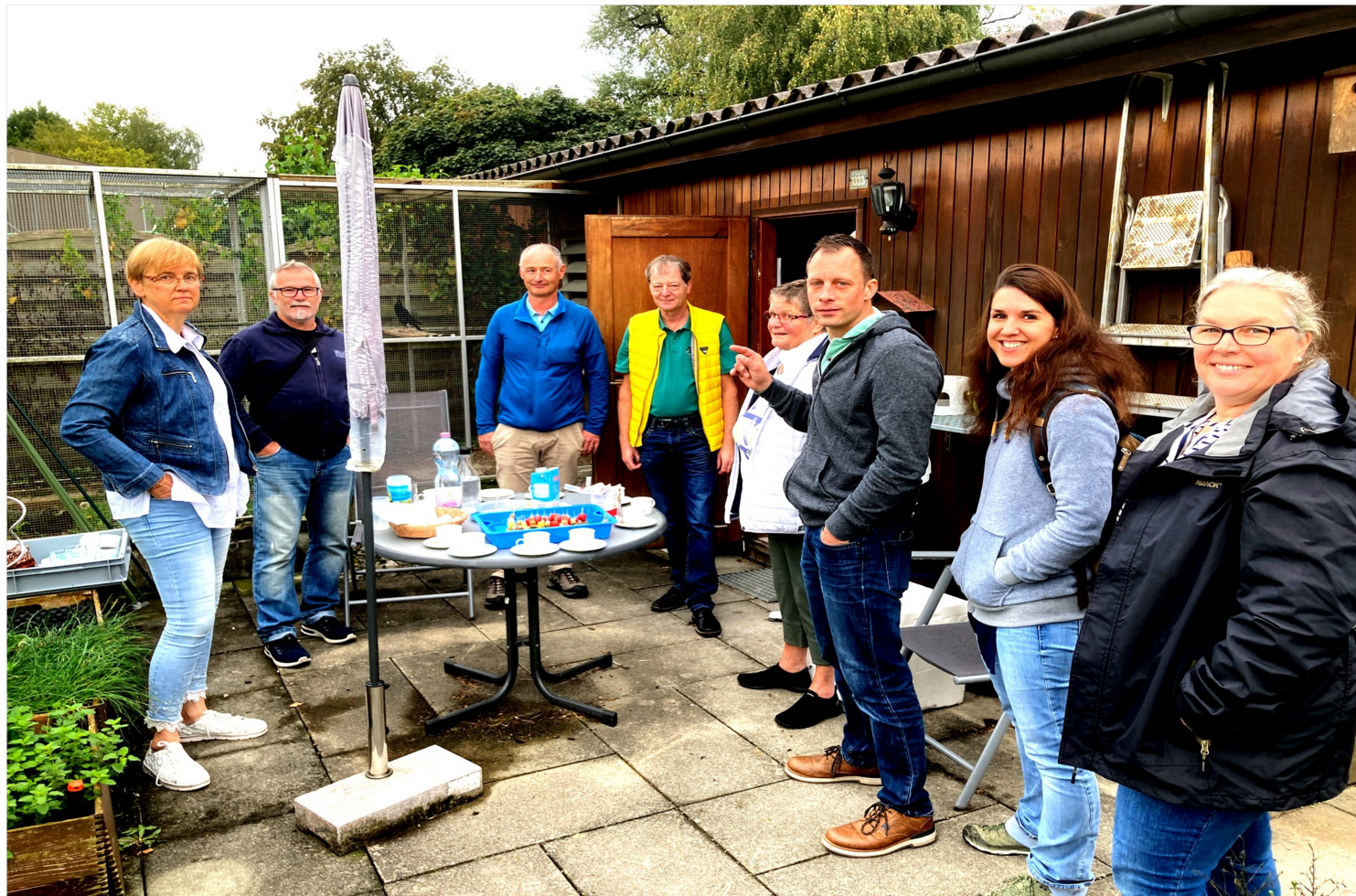
Erlebnistag Vorstand Rassetauben Schweiz

Journée récréative du comité de Pigeons de race Suisse