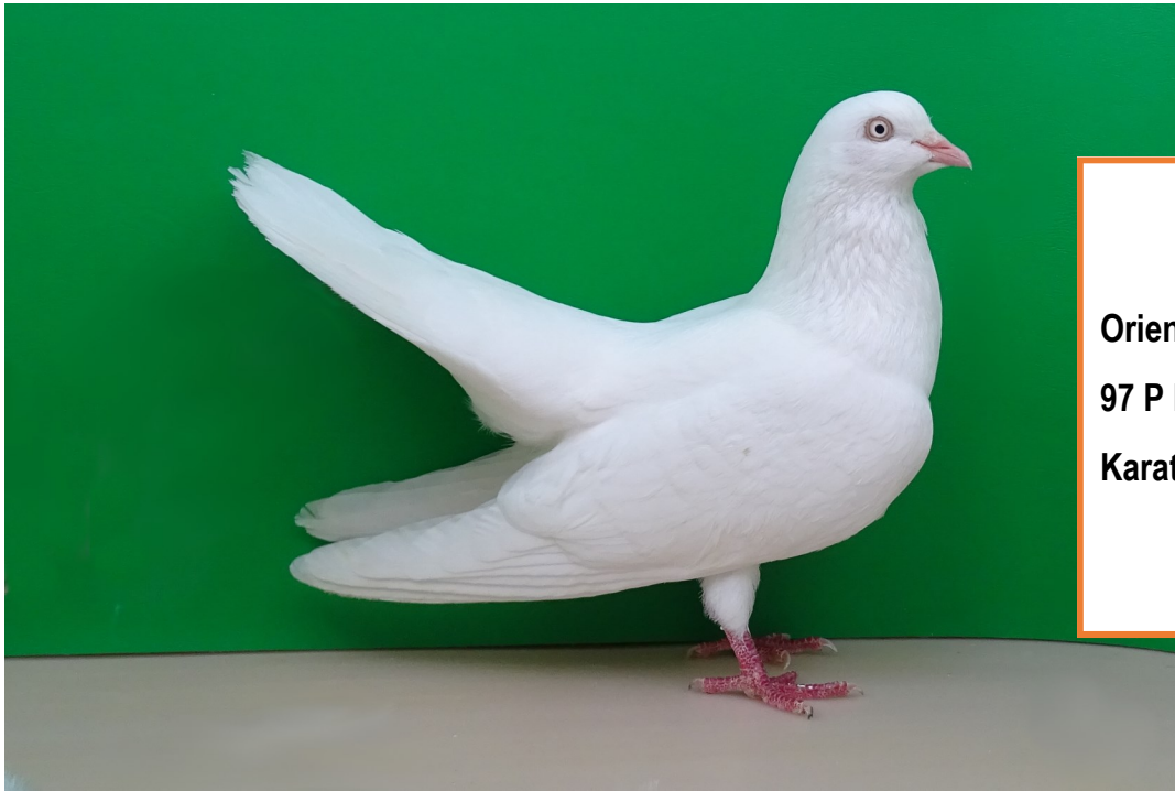
Orientalischer Roller, weiss 97 P Neuenkirch 24 Karat Rasim