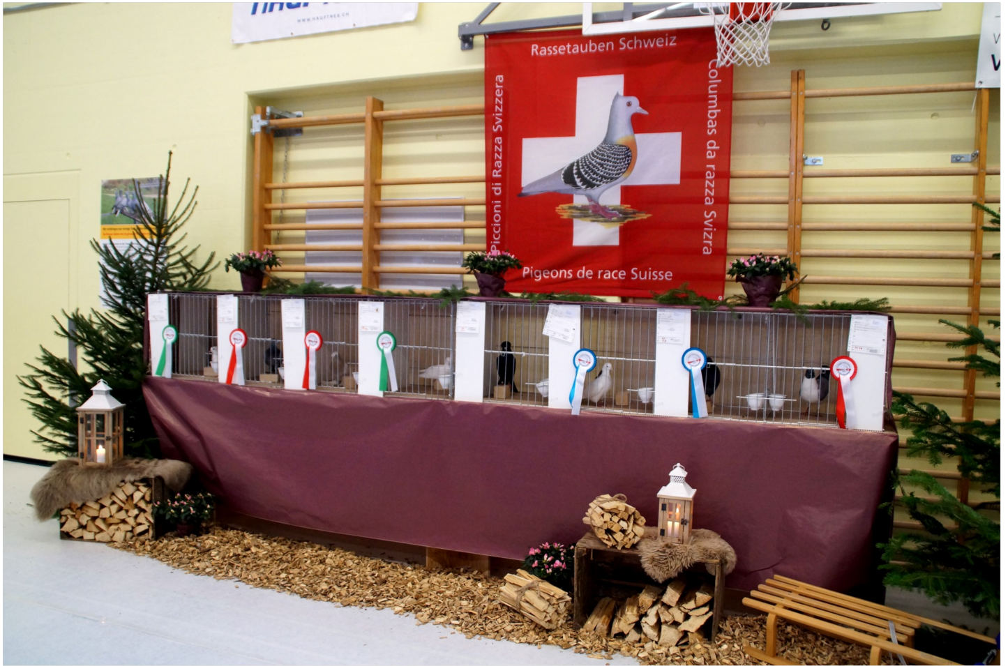
Präsentation der Schweizermeister 2023 / 24 in Neuenkirch