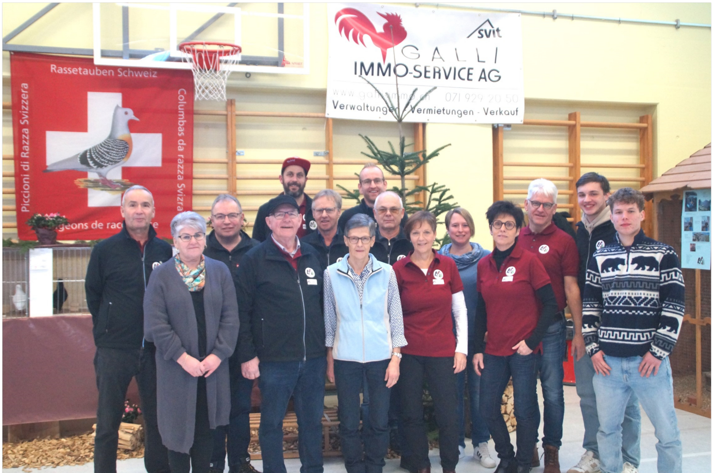
Organisationskomitee Nationale Taubenausstellung Neuenkirch 2023 / 24